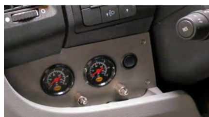
Auto specifiek bedieningspaneel CS set Air Master Ultra