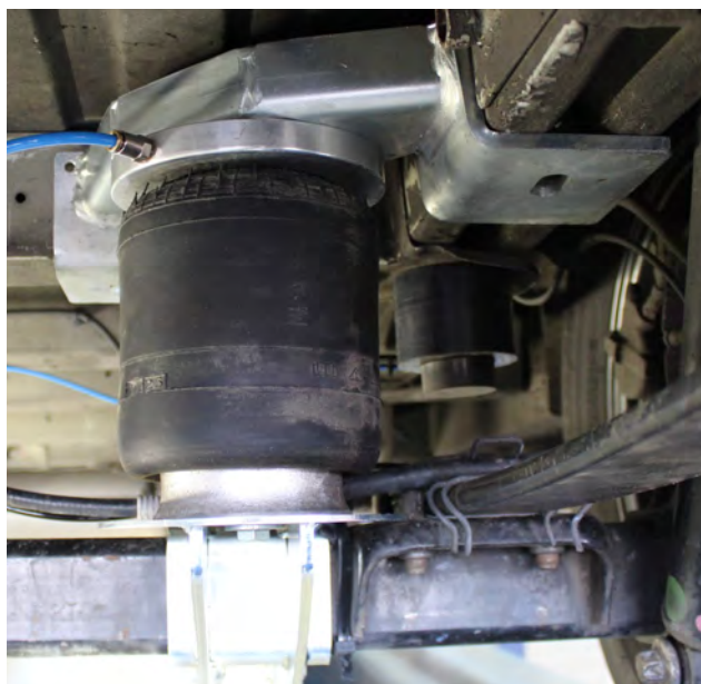
NR-137904 Air Master Ultra

75% van het comfort van volledige luchtvering voor minder dan de helft van de prijs!